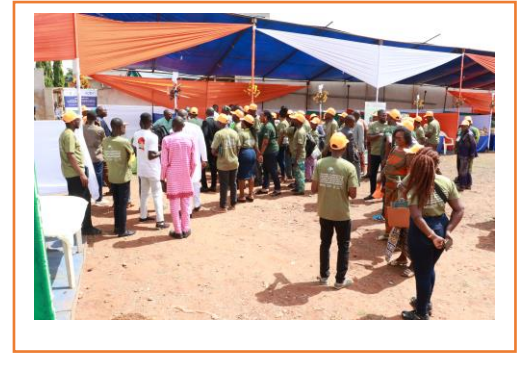
Vues séquentielles de la foire