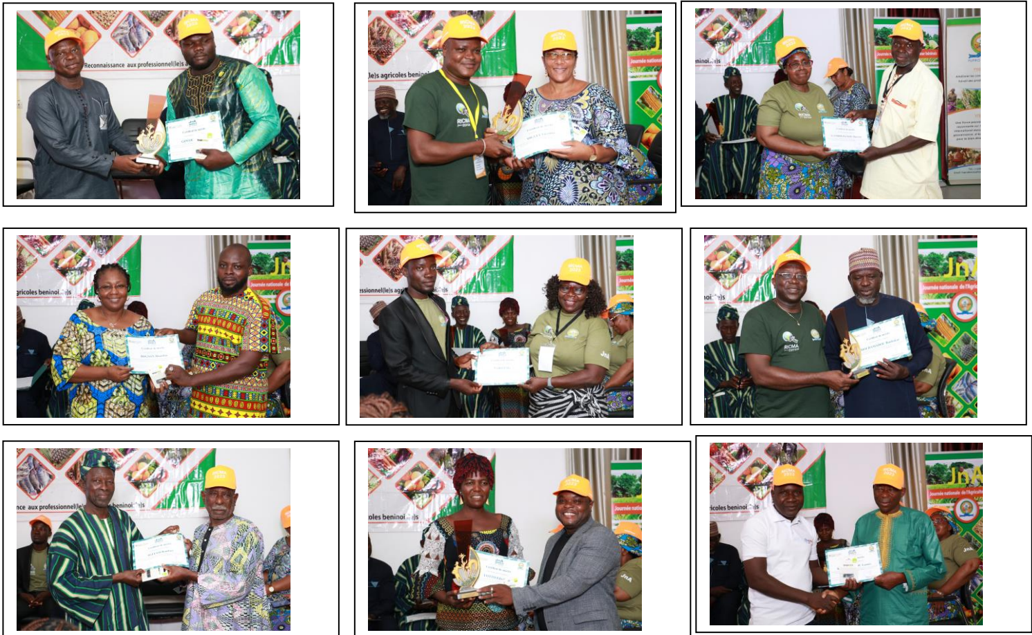
Vues séquentielles de la cérémonie de remise de prix aux producteurs modèles

part et de susciter les autres agriculteurs et agricultrices à une amélioration de leur profession d'autre part.