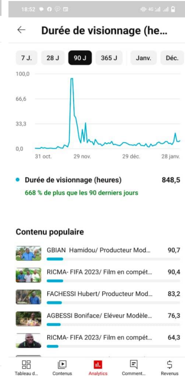
Capture données analytique chaine YouTube FUPRO-BENIN info