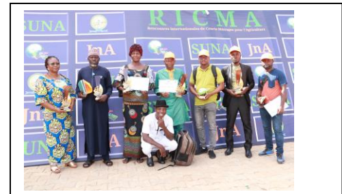
Vues séquentielles de la cérémonie de clôture