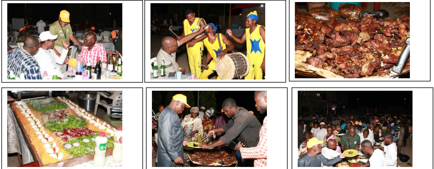
Vues séquentielles de la NuGA